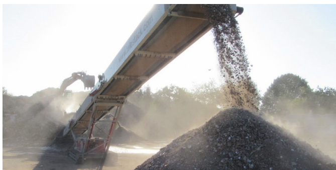
Anlage zum Brechen von Bauschutt