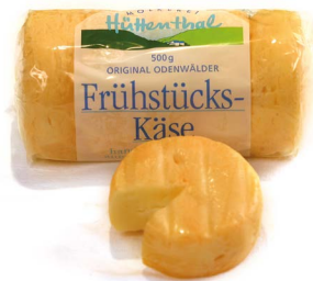
Odenwälder Frühstückskäse g.U.

Bei der „Geschützten Ursprungsbezeichnung“ (g.U.) müssen sowohl Rohstoffherzeugung als auch Verarbeitungs- und Herstellungsprozess in der betreffenden Region, dem Ort oder dem Land erfolgen. So müssen z. B. die Rohwaren für den Odenwälder Frühstückskäse aus der Region Odenwald stammen und auch die Verarbeitung sowie Herstellung dort stattfinden.