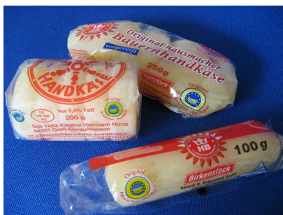
Hessischer Handkäse g.g.A

Bei der „Geschützten geografischen Angabe“ (g.g.A.) muss nur einer der Prozesse Erzeugung, Verarbeitung und Herstellung in der betreffenden Region, Ort oder Land stattfinden; z. B. muss der Hessische Handkäse in Hessen hergestellt werden.